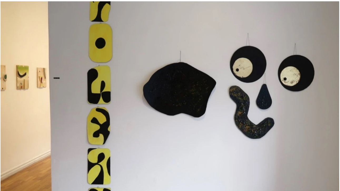
ADa konst i delmängd.

I sin nya bok "Koryféerna" gestaltar Lena Andersson fiktivt hur mordet på Olof Palme och maktspelet före och efter kan ha gått till. Hennes tes är att fiktionen är ett vassare sätt att komma närmare "sanningen" än torra, dokumentära fakta.